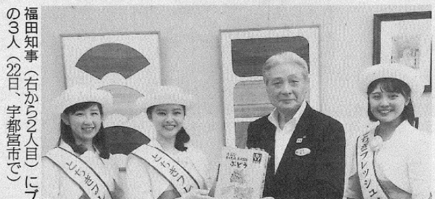
福田知事(右から2人目)に7 の3人(22日、宇都宮市で)